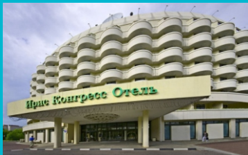
Гостиница "Ирис Конгресс Отель»

Переоснащение гостиницы тепловыми насосами Mammoth