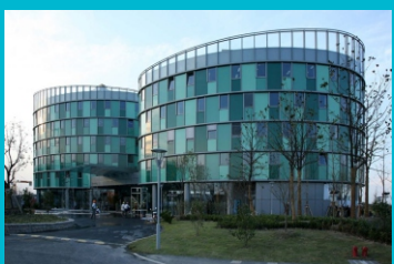
Ecological Construction - Shanghai Pujiangzhiyu