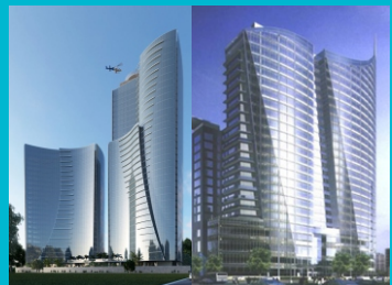
Shanghai Jianyi Mansion