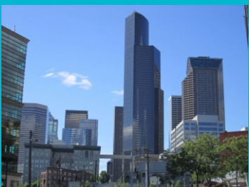
Columbia Seafirst Center